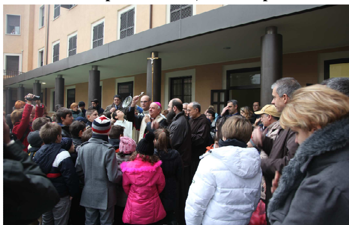
Nella foto in alto: il Vescovo benedice l'oratorio. A sinistra e sotto: il pomeriggio di festa

Nel pomeriggio, a partire dalle ore 15,00, si sono svolti, nonostante la pioggia, Tornei e Giochi animati dai giovani dell'oratorio e dai genitori, con distribuzione di panini alla porchetta, buon vino, e tante bibite.