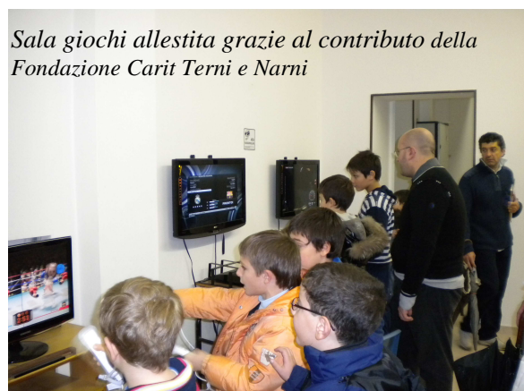
Sala giochi allestita grazie al contributo della Fondazione Carit Terni e Narni

Orientarsi fra le molteplici idee e suggerimenti della vita contemporanea, scegliere tra diversi modelli ed esempi, capire la differenza tra bene e male, dando nel contempo una certa coerenza alla propria vita, si rivela spesso un compito molto arduo che può causare nei giovani uno stato d'animo fragile e dubbioso.