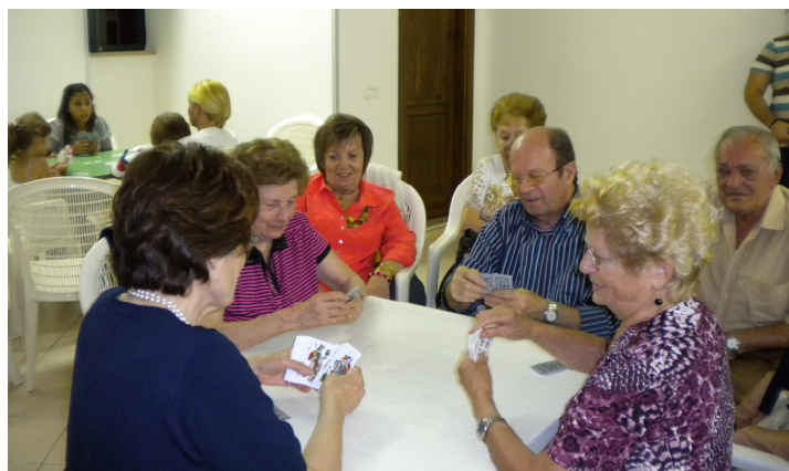
Nella foto a fianco: una fase del torneo di briscola che si è tenuto a settembre nell'oratorio

Martedì dalle 21 alle 22,30 (Gruppo Giovani) Mercoledì dalle 17 alle 18,30 (con karaoke per bambini dalle 17 alle 18) Venerdì dalle 16 alle 17 Scuola di Teatro Sabato dalle 16 alle 19 (con babydance dalle 16,15 alle 17,15)